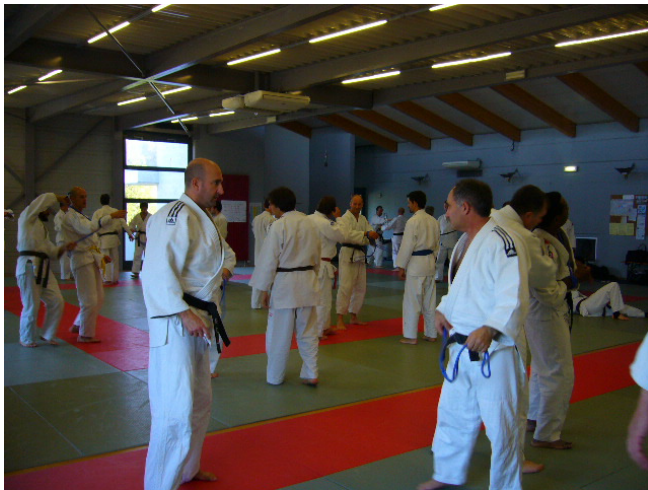
Ja so macht Würigen Spaß, gelle.....