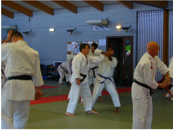
Alle waren mit Spaß und Eifer bei der Sache.