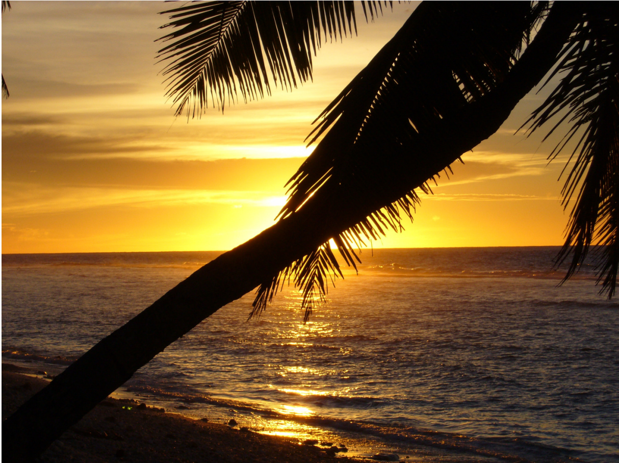
Bild- und Textkopien für gewerbliche Zwecke nur mit Genehmigung von M.Stapel